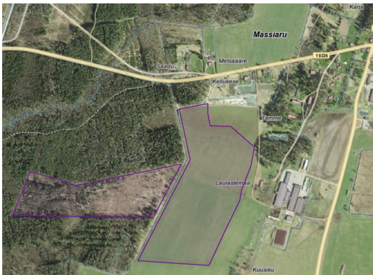
Taotletav Massiaru III liivakarjääri ala (märgitud lilla kontuurjoonega). Alus: Maa- ja Ruumiamet.

Taotletava mäeeraldis ja mäeeraldis teenindusmaa pindala on 24,49 ha. Kaevandamisloa taotluse kohaselt oli seisuga 01.01.2020 mäeeraldisega seotud ehitusliiv (aktiivne tarbevaru 699 tuh m 3 ja kaevandatav varu 641 tuh m 3 ). Maavara kaevandamise keskmiseks aastamääraks taotletakse 46 tuh m 3 . Keskkonnaluba taotletakse 15 aastaks. Keskkonnaamet algatas kavandatavale tegevusele KMH 09.12.2021 kirjaga nr DM-110955-20.